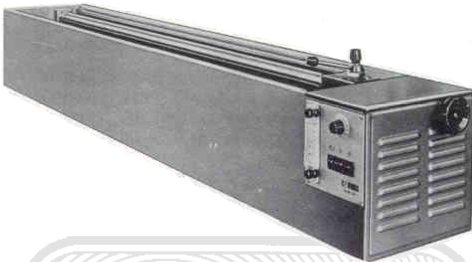
FIGURA 1.- Ductilómetro