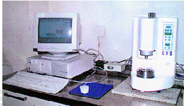
FIGURA 1.- Reómetro de corte dinámico típico