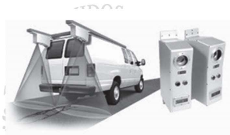
FIGURA 1.- Equipo escáner acoplado en vehículo

calidad que cumpla con los requisitos del sistema de medición, los cuales contarán con las siguientes características: